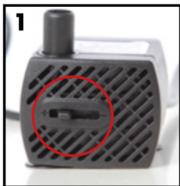
vodní čerpadlo / vodné čerpadlo/ pompka